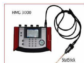
Le StatStick innovant avec le HMG 3000